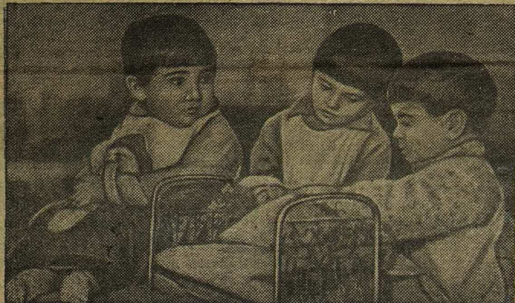
В детских яслях № 247 Московского района (Ленинград).